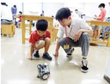
思い通りに動いているかな？

毎年、子どもたちが楽しみにしている「レゴロボット製作教室」。昨年度より近隣の高校に協力をお願いして高校生ボランティアの募集を行っています。