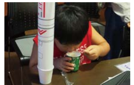
日本が誇る「きな粉のおもち」美味しい！

宇宙と同じ環境で、マシュマロやお湯がどのように変化するかなど、予想して実験で確かめました。予想の中には奇想天外なものもあり、実験を通して楽しく学びました。