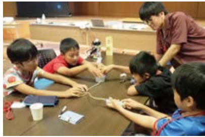
おおっ！マシュマロがっ！！

午後の小学4年生から中学3年生のファンダメンタルコースでは、身近にある材料を使って、宇宙と同じ環境を作りました。