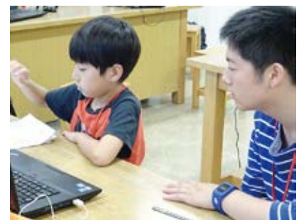
見守って待つことも大切な役目です

小学4年生以上から受講できるレゴロボットは、パソコンに文字を入力するのに「ローマ字」が必要！5年生や6年生だとわかる子もいるけれど、習ったばかりのローマ字をパソコンのキーボードから探すのが大変です。高校生のお兄さんがサポートして入力のお手伝いをしてくれます。