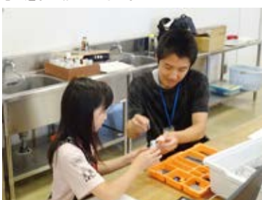
「ここはこのパーツだね」

初級はジグザグ競争や相撲対決があるので、参加する子どもは真剣に勝ちを狙います。どうやったら相手に勝てるのかアドバイスや応援を受けて一緒に楽しい時間を過ごしました。