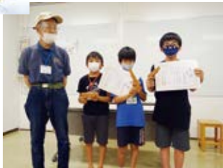
→ ゴム銃射撃協会武豊支部長の 内田さんと今年度の入賞者