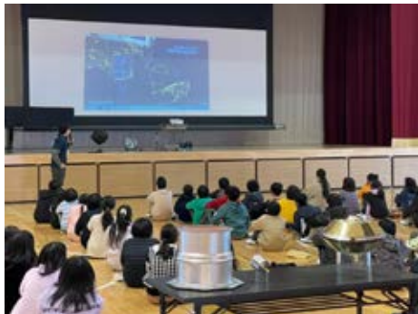
映像を見ながらの説明はわかりやすかったです