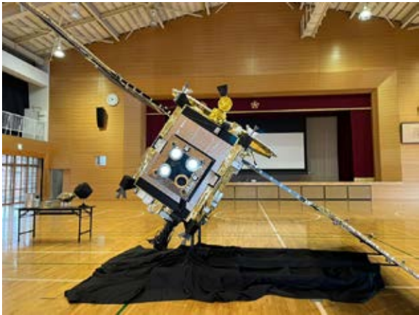
体育館にタッチダウン！

2月4日(金)から8日(火)にゆめたろうプラザで行われる「小惑星探査機『はやぶさ2』帰還カプセル展示 in たけとよ “遙かなる宇宙への挑戦Ⅱ”」に向け、町内の小学校でアウトリーチを行いました。