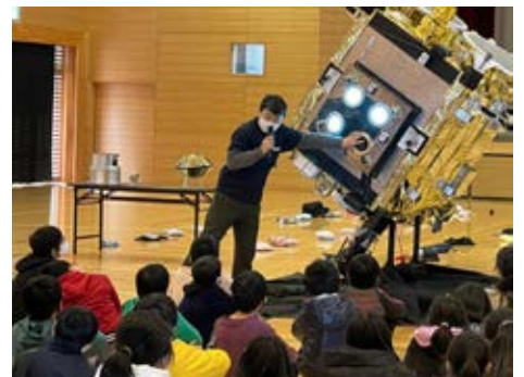
間瀬さんは「はやぶさ2」のことをたくさん知っています

解説の後は、実物大模型の前に移動し、部品ごとにどんな役目を果たすのかを教えてもらいました。