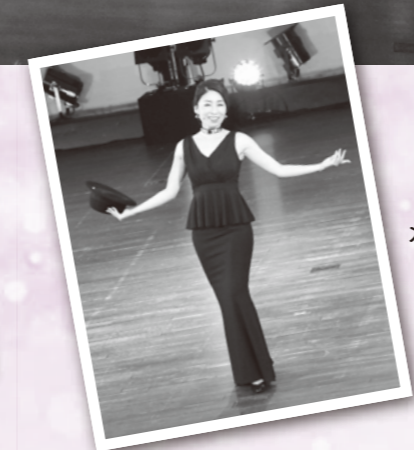
名古屋芸術大学 ミュージカルコースの メンバーによる楽しい歌と ダンスが舞台に 華を添えてくれました!!