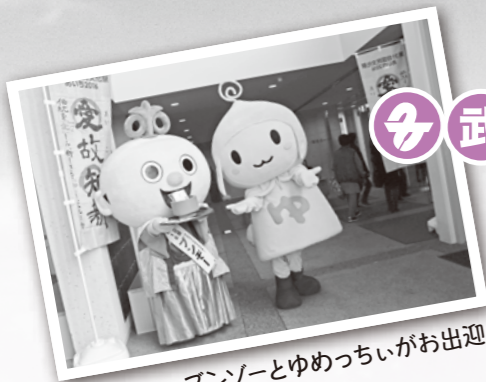
ガンゾーとゆめつちいがお出迎え

武豊町では第31回 国民文化祭の開催に合わせ「みんなが主役!幸福度No.1のまち」を合い言葉に「協働のまちづくり フォーラム」を行いました。