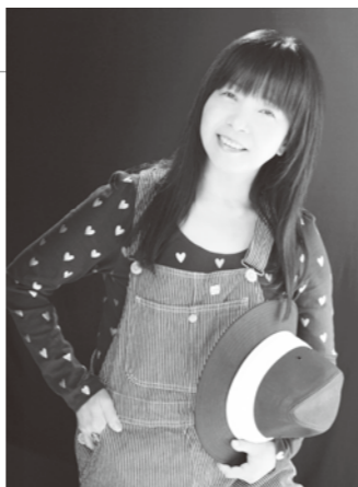
イルカほのぼのコンサート ~We Love You Planet!~

1975年になごり雪が大ヒット!以来、地球といのちの大切さを歌い続けるシンガーソングライター。「まあいいのち」、「サラダの国から来た娘」など、懐かしい名曲の数々とともに、イルカのあたたかな歌声と楽しいトークに包まれながら、ほのほのとしたひと時をゆったりと過ごしてみませんか。