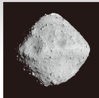
見えてきたリュウグウの姿 (2018年6月26日、03:50(日本時間)頃の撮影。)

武豊町(ゆめたろうプラザ)では、2011年8月にゆめたろうプラザで開催した小惑星探査機「はやぶさ」帰還カプセル展示をきっかけに、小惑星探査機「はやぶさ」「はやぶさ2」を応援しています。みなさんも小惑星探査機「はやぶさ2」の今後に注目しましょう!