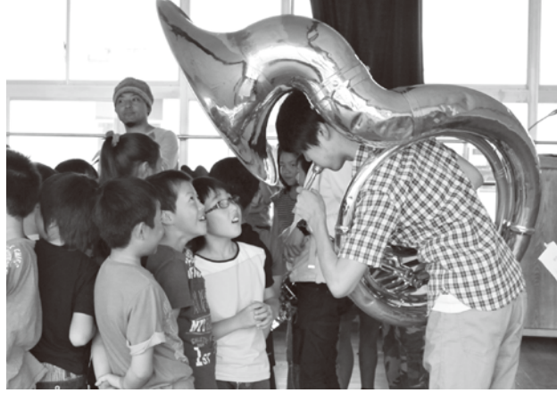
BLACK BOTTOM BRASS BAND