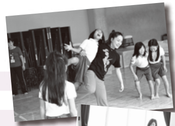
パパ・タラフマラ