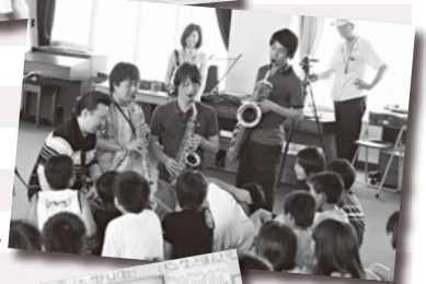
カルテット・スピリタス