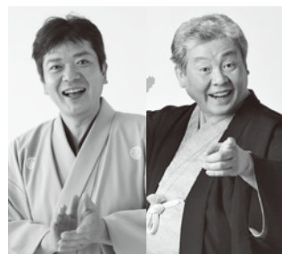
立川談笑・柳家喬太郎