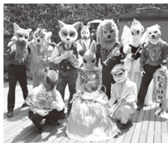
ズーラシアンプラス