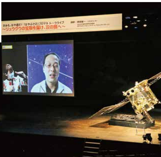
はや通トークライブの様子&はや通トークライブ配信中 (写真左上)

今、注目は、4月17日(土)の「めざせ!はや通 津田雄一プロマネ講演会『きみも、はや通だ! 『はやぶさ2』プロマネトークライブ~リュウグウの宝物を届け、次の旅へ~』」で、ライブ配信に取り組んだ ゆめプラ配信チーム。撮影、スイッチング、インターネット配信と、舞台スタッフのサポートを受け、それぞれのメンバーの得意なところを活かして、みんなで作る配信チームです。