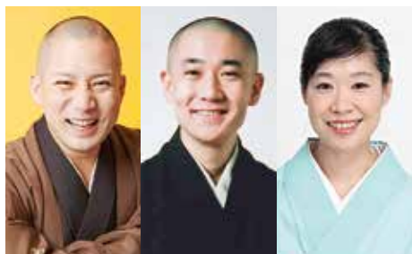
春風亭一之輔

その他に「話し方講座(9月18日、10月9日)」「アフレコ体験講座(10月9日)」「アニメーション制作講座(12月5日)」が予定されています。