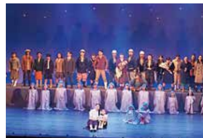
町民劇団 TAKE TO YOU