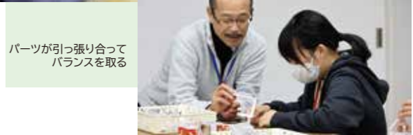
パーツが引|張り合ってバランスを取る