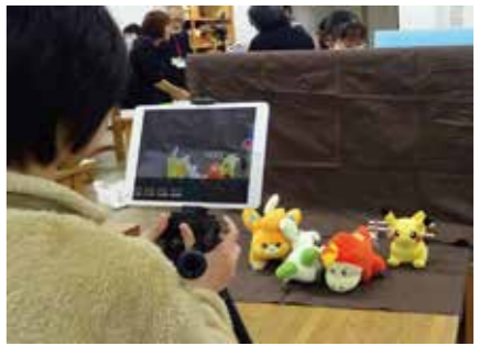
お気に入りのぬいぐるみたちが動いちゃう!

その他 各種イベント報告をご覧ください>>ゆめたろうプラザ ブログ http://www.yumetaro.net/blog/