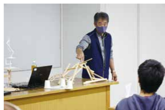
ランダムなようにだけど、計算されている不思議な構造

早くから受付予約がいっぱいになるほどの人気講座で、参加者は小学生から大人まで幅広い年齢層でした。