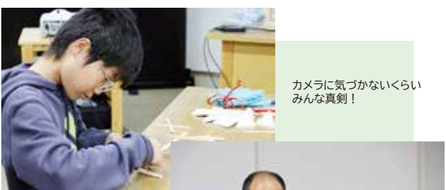
カメラに気づかないくらいみんな真剣!